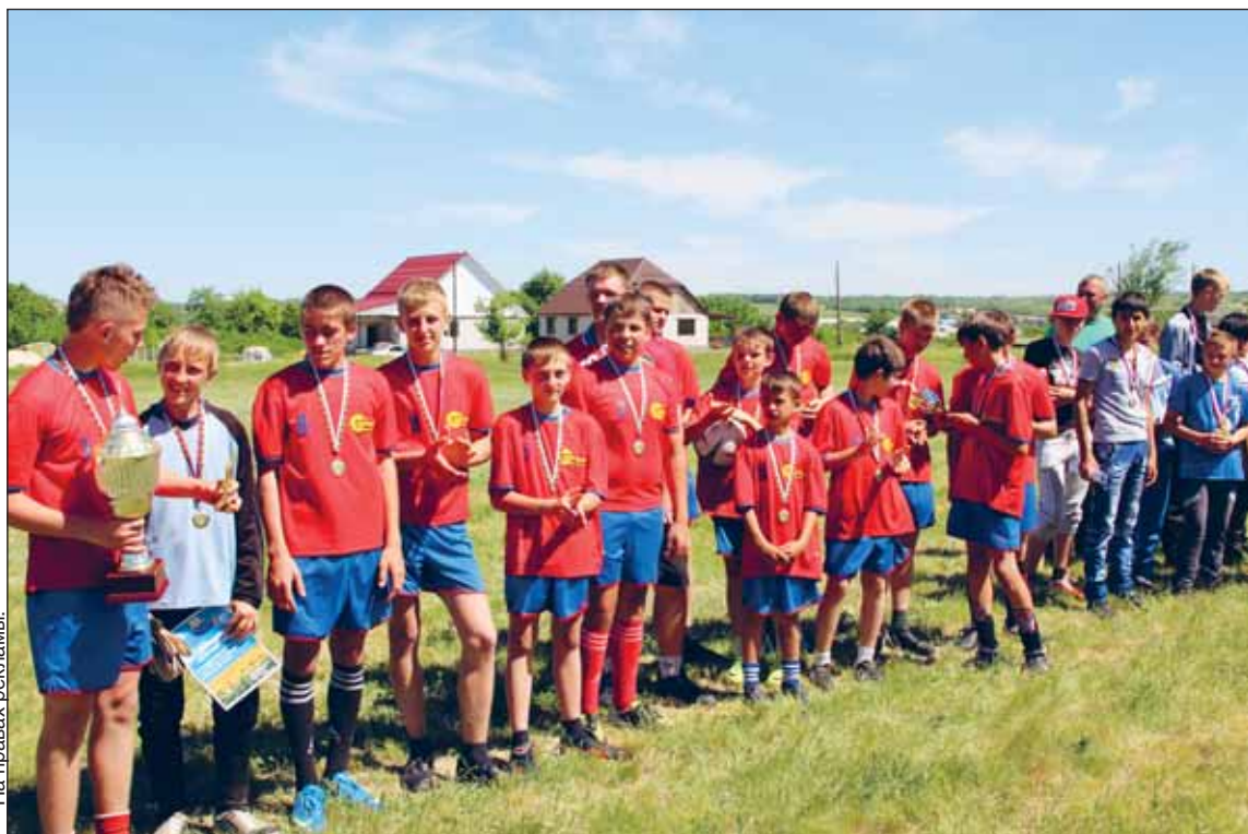
Обладатель кубка группы компаний «Агроспутник-2014» команда села Дьяченково.