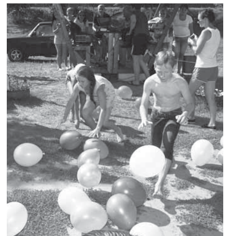
■ Конкурсантов было немало.