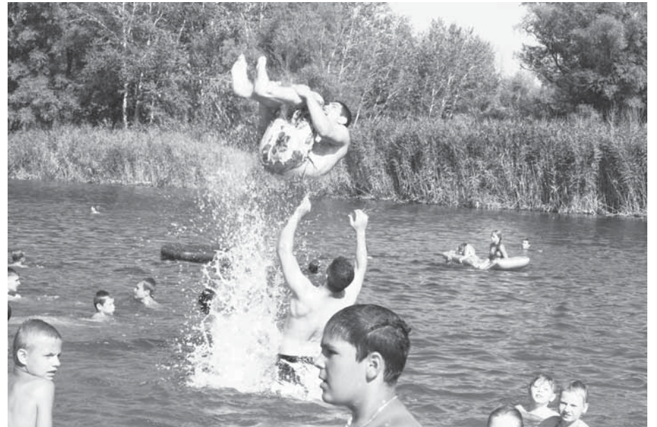
■ Праздник завершился всеобщим купанием в реке.

Правда, в основном молодежь пришла на праздник в пляжных костюмах