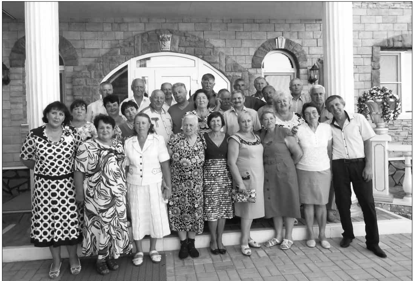
■ Дружный класс – почти в полном составе.

На стационарном посту ДПС трассы М-4 «Дон» в Богучарском районе сотрудники Госавтоинспекции остановили 22-летнего пешехода с большим вещевым мешком, направлявшегося в сторону города Ростова. На вопрос сотрудников, что переносит в мешке, он стал заметно нервничать и возмущаться. Полицейские решили провести досмотр, в ходе которого в одном из отделов рюкзака пешехода нашли полимерный пакет с веществом растительного происхождения, имеющим характерный запах конопли, вес – 7,56 гр. Гражданин был доставлен в ОМВД России по Богучарскому району. По данному факту проводится проверка, рассматривается вопрос о возбуждении уголовного дела.