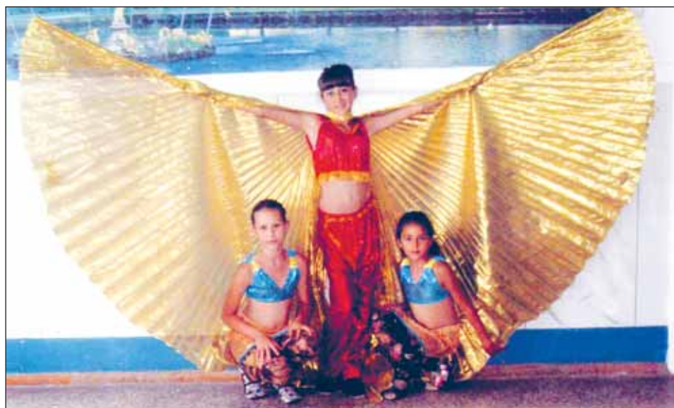
Юные танцовщицы никого не оставили равнодушным.