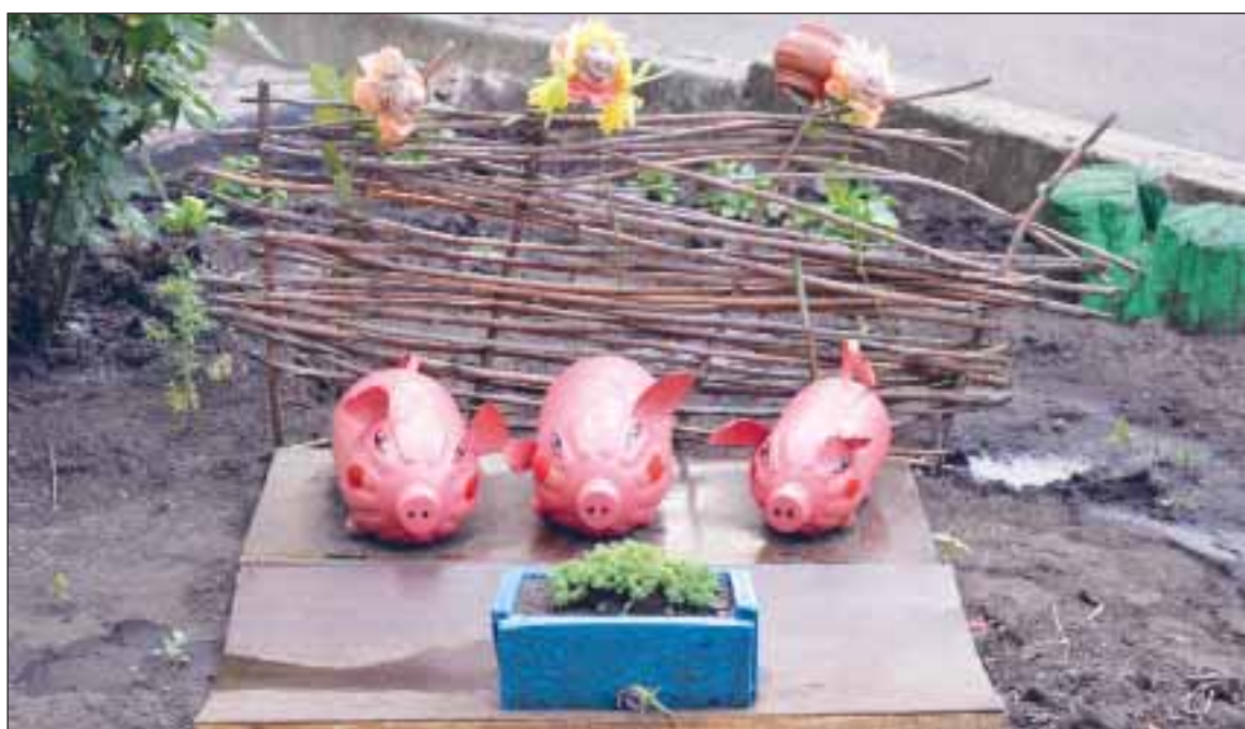
Совсем как настоящие.

Этот снимок и другие, сделанные в этом же месте, принес в редакцию постоянный читатель нашей газеты Виктор Чеснаков. Вот только он не знал, кто автор этих поделок. Мы решили выставить фото в наших группах в соцсетях, где они в кратчайшие сроки набрали более ста «лайков». Вскоре мы узнали информацию о народных умельцах. На создание игрушек пошли пластиковые бутылки, крышки, пластмассовые ведра, разноцветная краска плюс немного фантазии.