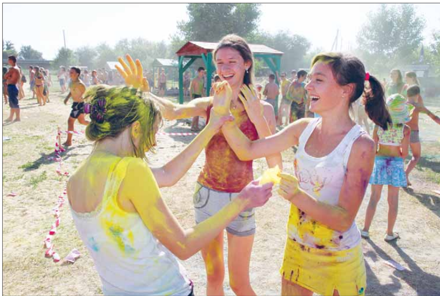
Богучарцам понравилось пачкать друг друга краской.

Около трёхсот юношей и девушек приняли участие в летнем празднике